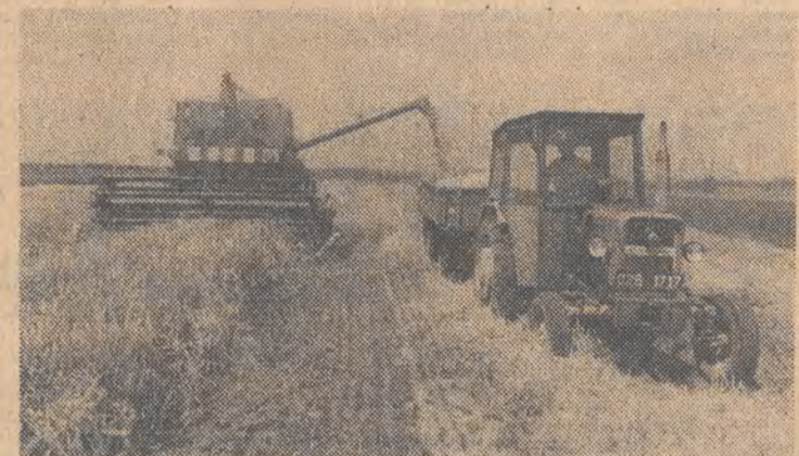
Na Opolszczyźnie trwają zbiory jęczmienia ozimego i rzepaku. Ponieważ pogoda sprzyjała, rozpoczęły się one tutaj o dwa tygodnie wcześniej.

Odzew z Krajowego Stowarzyszenia Strzeleckiego (NRA), półoficjalnego lobby producentów broni palnej, był natychmiastowy. „Trzeba liczyć nie trupy, a wypadki faktycznego zwalczania zagrożenia — a to nie oznacza jeszcze strzelania” — taka była podstawowa argumentacja. I nadal trzy czwarte Amerykanów posiadających broń podaje że kupiło sobie pistolet, rewolwer czy karabin, aby czuć się bezpieczniej.