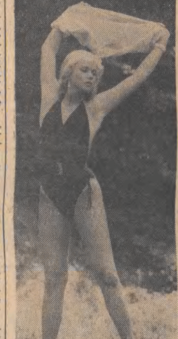
W tym sezonie na plażach znów najmodniejsze są kostiumy jednoczęściowe.

sywną linię polityczną, zmierzającą do przekształcenia Europy zachodniej i basenu Morza Śródziemnego w teatr wojenny”. (...) Jest to igranie z ogniem i narażanie na ryzyko życia ludzkości!”