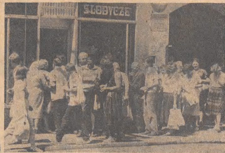
Są takie miejsca, w których o każdej porze ustawiają się kolejki. Dzieci latem przestawiają swój smak na lody — dorośli pragną odstąpić sobie życie w tradycyjny sposób.