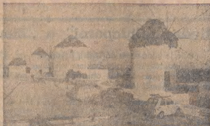
Na greckiej wyspie Mikonos, na Morzu Egejskim, uschowały się piękne i cenne do dziś wiatrak. Funkcyjne „małuchy” do dziś nie tylko orurowo.