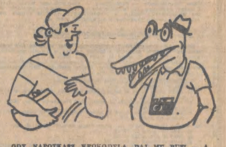
GDY NAPOTKASZ KROKODYLA, DAJ MU BUZI — A NIE DYLA!