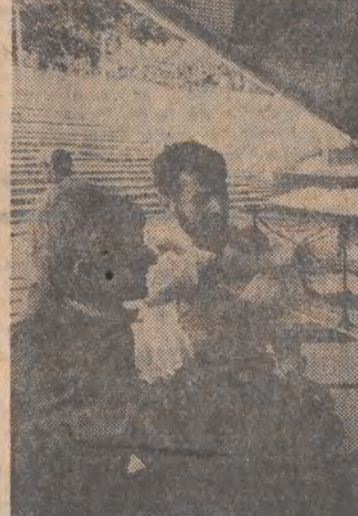
22 lipca rozpoczyna się XXIII Krajowy Festiwal Polskiej Piosenki w Opolu. W opolskim amfiteatrze trwają ostatnie przygotowania do tej imprezy...