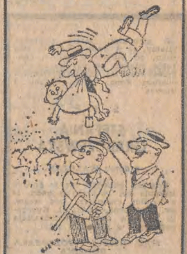
— To jest młody ginekolog! Właśnie odbywa staż...