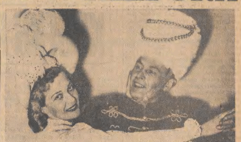
Jan Kiepura i Maria Eggerth w „Księżniczce Czardasa”.

Dwadzieścia lat temu przedwczesna i nagła śmierć wyrwała go z grona największych artystów operowych naszych czasów, ale jego sztuka i pamięć o nim pozostają. Życie i kariera Jana Kiepury owiane są już legendą. Od momentu swego debiutu śpiewaczego w 1923 r. w Warszawie, gdziekolwiek się pojawiał - oczekiwali go rozentuzjuszowani tłumy. Dziś może to nam się wydać dziwne, inaczej wyrażamy uwielbienia gwiazdom, choć można by w tym miejscu zapytać, czy w ogóle potrafimy je wyrażać? Ale wówczas, jak pisze Jerzy Waldorff, „drzwi nie otwierały się lecz pękaly, wśród grzmotu braw i ryku entuzjazmu stawał on, Jan Kiepura. „Niech żyje! Sto lat! Wiwat! Jasiu śpiewaj!” - Na to czekał. Krótkim ruchem uciszał tłum tak nagle, jakby gałka włączył dźwięk z głośnika radiowego, plac przed dworcem wypełniał jego niewiarygodnie potężny, metaliczny, jasny głos. „Brunetki, blondynki, a wszystkie was dziesięć, całować chce!”.