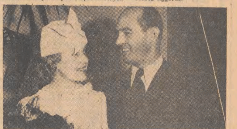
N/z: Ślub Jana Kiepury z Marią Eggerth w Katowicach.

Dwadzieścia lat temu przedwczesna i nagła śmierć wyrwała go z grona największych artystów operowych naszych czasów, ale jego sztuka i pamięć o nim pozostają. Życie i kariera Jana Kiepury owiane są już legendą. Od momentu swego debiutu śpiewaczego w 1923 r. w Warszawie, gdziekolwiek się pojawiał - oczekiwali go rozentuzjuszowani tłumy. Dziś może to nam się wydać dziwne, inaczej wyrażamy uwielbienia gwiazdom, choć można by w tym miejscu zapytać, czy w ogóle potrafimy je wyrażać? Ale wówczas, jak pisze Jerzy Waldorff, „drzwi nie otwierały się lecz pękaly, wśród grzmotu braw i ryku entuzjazmu stawał on, Jan Kiepura. „Niech żyje! Sto lat! Wiwat! Jasiu śpiewaj!” - Na to czekał. Krótkim ruchem uciszał tłum tak nagle, jakby gałka włączył dźwięk z głośnika radiowego, plac przed dworcem wypełniał jego niewiarygodnie potężny, metaliczny, jasny głos. „Brunetki, blondynki, a wszystkie was dziesięć, całować chce!”.