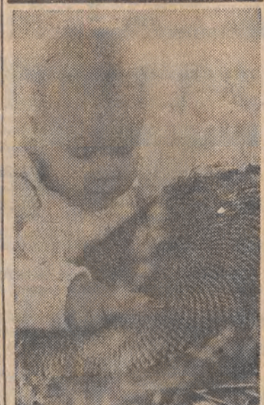
Zjem słonecznik większy ode mnie.