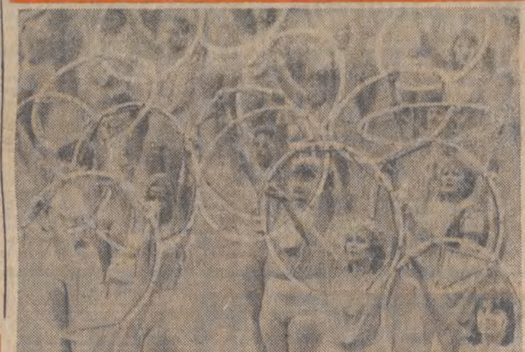
Próba generalna otwarcia mistrzostw świata w lekkiej atletyce na Neckarstadionie w Stuttgarcie.

Byłby ustrzeżenie przed zbyt jednostronnym obrazem, trzeba jednak dodać, że belgijskie środki masowego przekazu na ogół ukazywały poruszenie tutejszej opinii publicznej podstępą napaścią Niemców i bohaterką obroną Westerplatte. Oburzenie znacząco się także mocniej po nalotach bombowych na Warszawę.