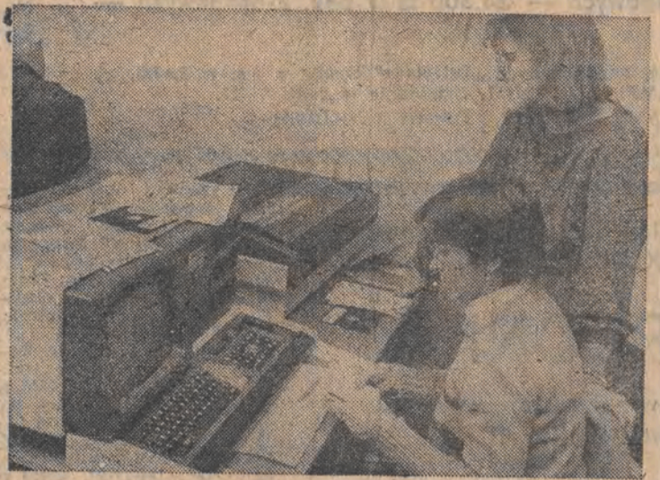
W oddziale Wojewódzkim PZU ewidencja ubezpieczeń i sprawy związane z księgowaniem wszystkich rachunków odbywają się już z pomocą „Robotronów”. Komputeryzacja tysięcy danych stanowi duże ułatwienie dla pracowników i pozwala uniknąć wielu błędów. WM.

Nieprzestrzeżenie przepisów w tym m.in. nielegalny obrót częściami zamiennymi, wady techniczne produktów prowadzenie działalności niezgodnej z posiadaniem uprawnień i itd. stały się przyczyną likwidacji 9 przedsiębiorstw zagranicznych w ciągu ostatnich kilku lat. Bywa i tak — mówił przedstawiciel WUSW — że dyrektorzy tych firm stają się paserami. Komuś brakowało cementu na segment, to postarali się, ale w sposób niezgodny z prawem. Ponieważ wiele podobnych spraw jest w toku, dlatego nie wymieniamy nazw przedsiębiorstw. W każdym razie Izba Skarbową WUSW, PIH i inne instytucje kontrolne prowadzi w tej chwili wiele podobnych spraw. WM