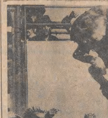
To zdjęcie z rodeo w Box Springs (USA) obiegło prasę światową i zdobyło swemu autorowi, Mike'owi Flata nagrodę w kategorii zdjęć sportowych.

Przewiduje od 12 do 16 bm. nadchłodno. Spodziewane jest zachmurzenie duże z rozproszonymi i okresowymi opadami. Temperatura maksymalna od 12 do 18 st., minimalna od 3 do 8 st.