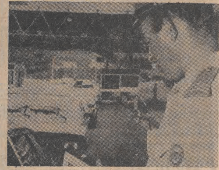
N/Z: żołnierze oddziałów specjalnych armii francuskiej, które rozlokowano wzdłuż granic lądowych, pomagają celnikom w kontroli osób przekraczających granicę z Hiszpanią.