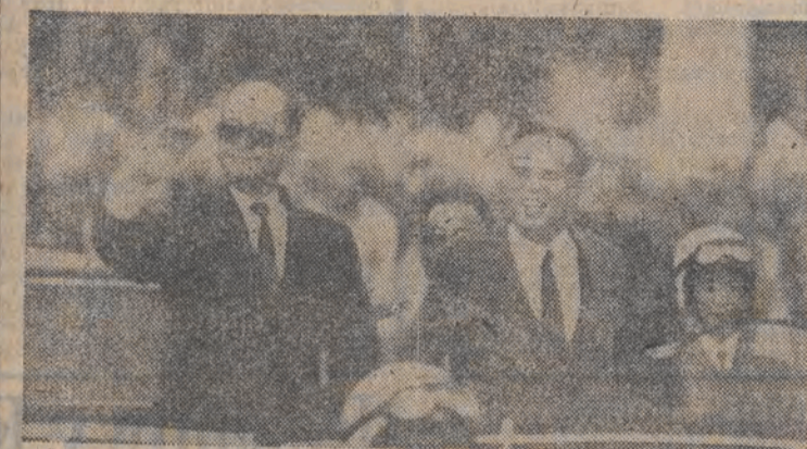
Wojciech Jaruzelski oraz Kim Ir Sen podczas przejazdu przez Phenian.

W środę po południu do Koreańskiej Republiki Ludowo-Demokratycznej na zaproszenie sekretarza generalnego KC Partii Pracy Korei, prezydenta KRLD Kim Ir Sena, z oficjalną wizytą przyjaźni przybył I sekretarz KC PZPR, przewodniczący Rady Państwa PRL Wojciech Jaruzelski.