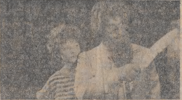
„Podróże Pana Kleksa”