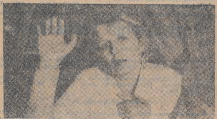
„Kochankowie mojej mamy”