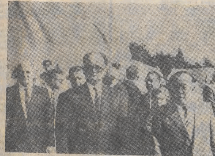
W. Jaruzelski w towarzystwie wiceprezydenta Ri Jong Oka złożył wieniec na Cmentarzu Rewolucjonistów.

W czwartek, w drugim dniu wizyty I sekretarza KC PZPR, przewodniczącego Rady Państwa Wojciecha Jaruzelskiego w Koreańskiej Republice Ludowo-Demokratycznej, rozpoczęły się rozmowy między partyjno-państwowymi delegacjami Polski i KRLD.