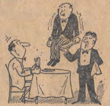
Pan prosił o kierownika?