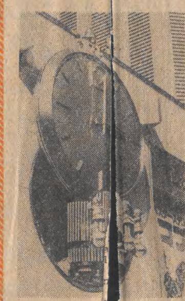
Najnowsza moda w Japonii — uliczne zegary z pozytywką.