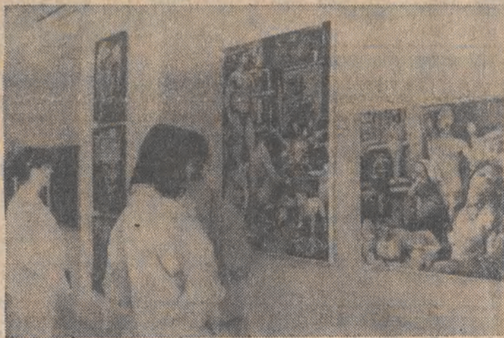
Wystawa współczesnego malarstwa polskiego „Świat wyobraźni” ze zbiorów muzeum łódzkiego otwarta została w Polskim Ośrodku Kultury i Informacji w Berlinie.