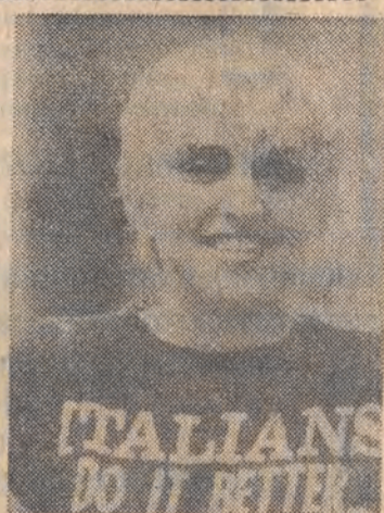
Madonna wciąż na szczycie.