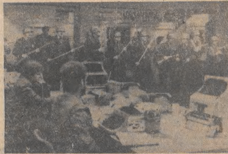
Pracownicy „Tiempo Argentino” postanowili sami wydawać swoją gazetę po ogłoszeniu bankructwa przez jej właściciela. N.Z.: dziennikarze kontynuują prace mimo silnej obstawy policji.