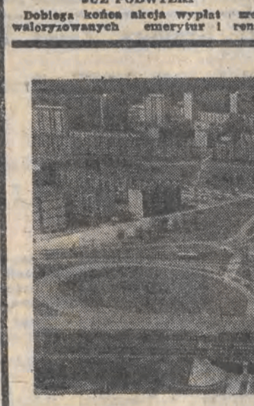
POLESIE. Dzielnica Łodzi, która łączy w sobie przemysłową rzeczywistość miasta z aspiracjami do odgrywania znaczącej roli naukowej. Tutaj mieszczą się znanne i cenione w całym kraju zakłady przemysłowe, których firmowe znaki na dobre zadomowiły się w świadomości konsumentów i handlowców, jako synonimy wysokiej jakości i dobrego wzornictwa. Mam na myśli ZWO „Vera”, LZPG „Stomil”, ZPW im. A. Struga. Politechnika Łódzka jest prężnym ośrodkiem naukowo-badawczym, którego sukcesy znane są daleko poza granicami kraju. Poleska „sypialnia” - Retkonia - należy do najlepiej zagospodarowanych i prowadzących odłdy mieszkaniowych w mieście. Na uwagę zasługują wybudowane w dziedzi odłarności pokeskich zakładów pracy - Szkoły Podstawowej nr 44. Inwestycja ta przyczyniła się do złagodzenia oświatowych trudności na Retkini.

Dzisiaj obraduje XXVI Dzielnicowa Konferencja Sprawozdawczo-Wyborcza PZPR Łódź-Polesie. 208 delegatów reprezentujących ponad 11.500 członków i kandydatów partii, obradować będzie i radzić nad trudnymi problemami rozwoju swojej dzielnicy. Partyjne forum będzie także okazją do wymiany doświadczeń i do podzielenia się sukcesami. (Z. Ch.)