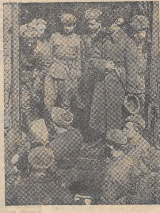
I korpus Wojska Polskiego w drodze na front.

radzieckiej 28 armii stoczyła bój pod Lenina. W dniach 12—13 października i DP, wykonując swe pierwsze zadanie bojowe, w ciężkich walkach aforowała Miareję i jej bagnistą dolinę, przełamała silną obronę nieprzyjaciela, opanowała jego pierwszą pozycję i przesunęła się w głąb, niszcząc przy tym węzłowe punkty oporu Niemców we wsi Potruchy i na wzgórzu 215.5. Mimo silnych kontrataków nieprzyjaciela, wspieranych czołgami, działami pancernymi oraz masą samolotów bombowych i szturmowych (w ciągu dwóch dni 43 naloty — średnio po 30 samolotów każdy), i dywizja nie cofnęła się, zadając nieprzyjacielowi duże straty. Hitlerowcy na polu walki pozostawili 1.378 poległych, a 326 Niemców dostali się do niewoli. Zdobyte bądź zniszczone wiele sprzętu bojowego i amunicji, w tym między innymi 41 ciężkich karabinów maszynowych, 23 ręczne karabiny maszynowe, 8 przeciwlotniczych karabinów maszynowych, 33 moździerze, 9 dział, 2 czołgi. Stracono też 5 samolotów.