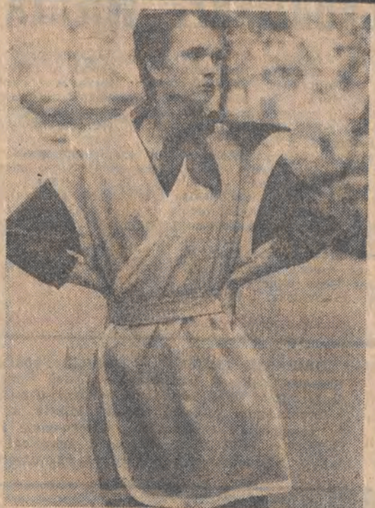
Spółdzielnia Artystów Plastyków w Łodzi, która skupia aż 400 członków, świadczy usługi plastyczne oraz prowadzi sprzedaż unikatów m. in. ubiorów dla pań. Cieszą się one ogromnym powodzeniem. Nic w tym dziwnego, skoro praktycznie każdy „ciuch” jest inny i do tego naprawdę atrakcyjny.