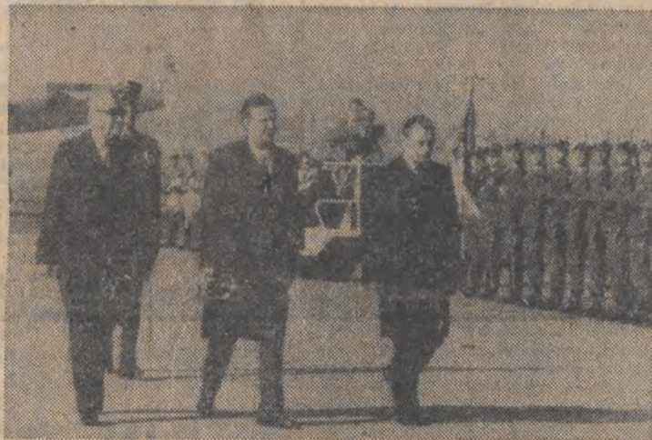
Podczas uroczystego powitania na warszawskim lotnisku Okęcie.