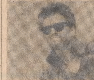
George Michael na Wembley

Choć od poźnego koncertu duetu Wham! na stadionie Wembley minęło już kilka miesięcy, piosenki z repertuaru George'a Michaela i Andrew Ridgleya mają nadal wielu zwolenników. Kilkanaście z nich — tych starszych i nieco nowszych — ukazało się niedawno na podwójnym albumie Wham! Tymczasem George Michael zaczyna podobno już pracować nad nowymi nagraniami z myślą o płycie solowej.