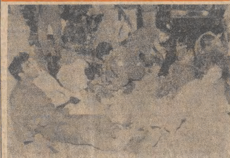
Izrael. W wyniku wybuchu 3 granatów ręcznych w starej części Jerozolimy 50 osób zostało rannych z 1 zginęła. W/A/1 skroja ratunkowa.

Nieuleczalna dotąd choroba AIDS (zespół nabytego braku odporności) zbiera swe łagodne żniwo także wśród małych dzieci. Według ostatnich doniesień lekarzy, w Berlinie Zachodnim ofiarą tej groźnej choroby stało się dotychczas 16 dzieci. W przeciwieństwie do dorosłych, źródłem zakażenia jest w tym wypadku nie zewnętrzny kontakt z nosicielem wirusa, lecz organizm własnej matki. Dzieci zarażają się AIDS w trakcie życia płodowego w łonie matki.