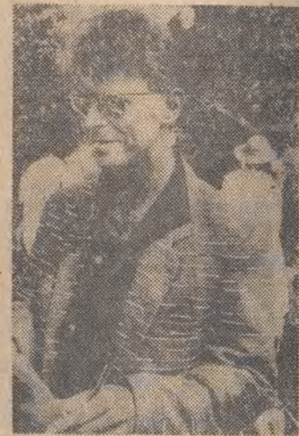
David Bowie na pewno ma powody do zadowolenia

We wrześniu na amerykańskiej liście bestsellerów płytowych wysoka pozycję zajmował longplay „Like a Rock”. Jego autorem jest Bob Seger — 41-letni kompozytor i piosenkarz — należący dziś do najpopularniejszych wykonawców w USA. Seger zdobył sławę po raz pierwszy w 1976 roku dzięki płycie „Live Bullet”, uznanej przez krytyków za jeden z ciekawszych albumów koncertowych, jakie wydała muzyka rockowa.