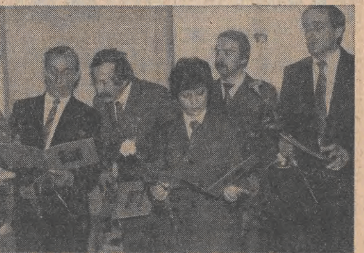
N/z.: laureaci nagrody zespołowej — realizatorzy Ogólnopolskiego Festiwalu Piosenki Harcerskiej w Siedlcach.

za twórczość artystyczną dla dzieci i młodzieży