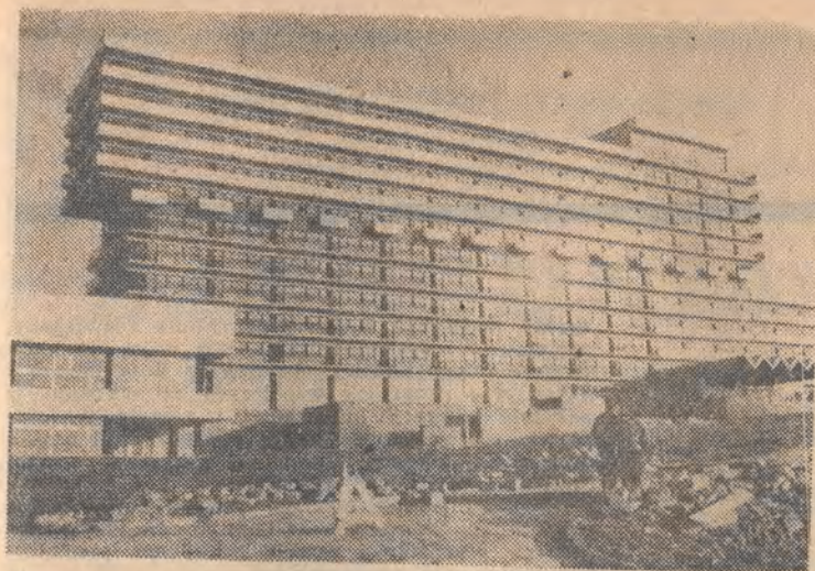
W Ustroniu Zawodzie (woj. bielskobialski) dobiega końca budowa szpitala-sanatorium na przeszło 800 miejsc. Będą tu leczone choroby narządów ruchu, układu oddechowego i układu krążenia. Już pod koniec listopada szpital-sanatorium przyjmie pierwszych 100 kuracuzów.