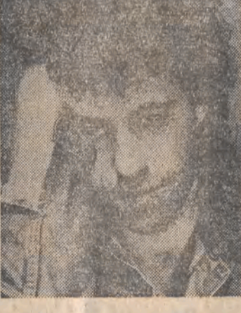
Bob Geldof wygląda na zmęczonego.

Bob Geldof — lider zespołu The Boomtown Rats, znany również jako organizator akcji charytatywnych na rzecz ofiar klęski głodu w Afryce — wydał niedawno autobiografię, zatytułowaną „Is That It?” („Czy to jest to?”). Książka podobno sprzedaje się doskonale, a zamówienia na jej kieszonkową wersję w miękkiej okładce osiągnęły 0,5 mln egzemplarzy, zanim jeszcze wydanie trafiło do sklepów. Tymczasem dużym powodzeniem wśród melomanów cieszy się solowy singel Boba Geldofa z utworem „This Is