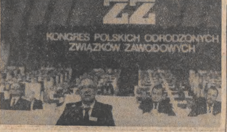
N/z.: przemawia Alfred Miodowicz.

ranów pracy, organizatorów socjalistycznego współzawodnictwa pracy, osobistości naszej nauki, kultury, wybitnych ludzi sportu. Rozlegają się dźwięki hymnu narodowego. Głos zabiera przewodniczący OPZZ Alfred Miodowicz. Mówi: Przejrzany moment w życiu naszego ruchu zawodowego. Po latach, jakże trudnych wydarzeń, kryzysu i rozbitcia, a w konsekwencji rozwiązania wszystkich struktur związkowych, odrodziliśmy się na gruncie klasowym, nawiązując do stuletnich postępowych tradycji pol-