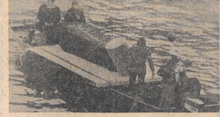
SZWAJCARIA. W Bazylei odbyła się oryginalna demonstracja przeciwko zatruciu Renu przez zakłady chemiczne SANDOZ. Na zdjęciu: łódź z demonstrantami i symboliczną trumną dla wszystkich organizmów, które zginęły w rzecze.

— To był bardzo miły wieczór! Daj mi znać, gdy zbierasz pieniądze na taki następny!