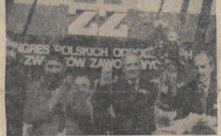
SOBOTA była dniem kongresu również pracowitym jak poprzednie. przyniosła wiele ważnych decyzji. Delegaci przyjęli statut OPZZ.

przyjęcie wielu ważkich decyzji określających cele, kierunki i formy pracy ruchu związkowego na następne lata. Szczególnie miejsce zajmuje ZWIĄZKOWY PROGRAM DZIAŁANIA i UCHWAŁA KONGRESOWA, a także stanowiska wobec węzłowych problemów społecznych i gospodarczych kraju. Delegaci z uwagą wysłuchali przemówienia premiera, który odniósł się do wielu uwag i pytań skierowanych do rządu przez delegatów.