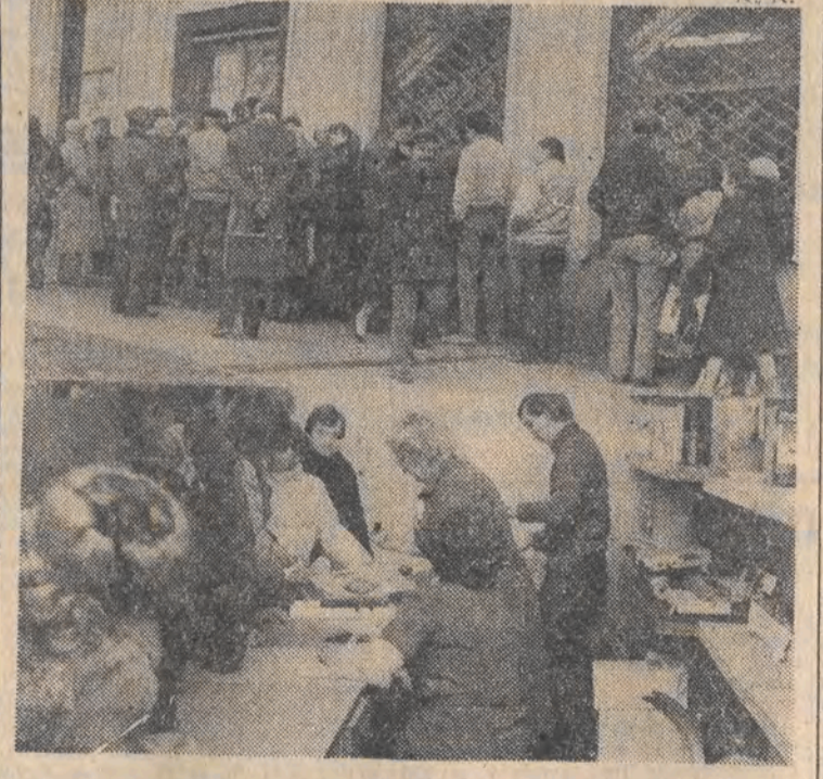
Na zdjęciu: wczorajsza kolejka po nowoczesność.

Wczoraj obsłużył pierwszych klientów w naszym regionie sklep z komputerami. Co prawda, działy w Łodzi dwa sklepy „Domaru” ale tam można kupić tylko to, co prywatnie posiadacze zechcą w nich sprzedać. Tymczasem tódzka placówka Centralnej Składnicy Harcerskiej oferuje komputery, kupowane w firmie polonijnej oraz u jednego z producentów z Honolulou. W tym