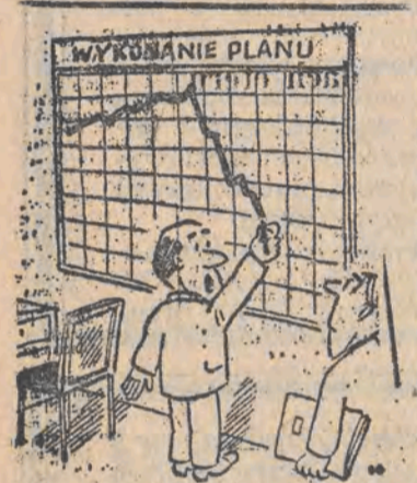
Przynajmniej nie potrzeba wchodzić na krzesło!