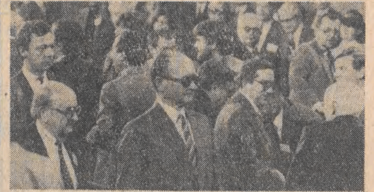
W. Jaruzelski wśród uczestników forum.

W Jabłonie dobiegło końca trzydniowe spotkanie okrągłego stołu, w którym uczestniczyli wybitni publicyści międzynarodowi, reprezentujący wpływe redakcje prasowe oraz liczące się stacje radio- i telewizyjne z państw-sygnatariuszy Aktu Końcowego KBWE.