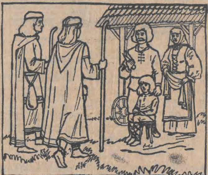
Malowanka — zgadywanka