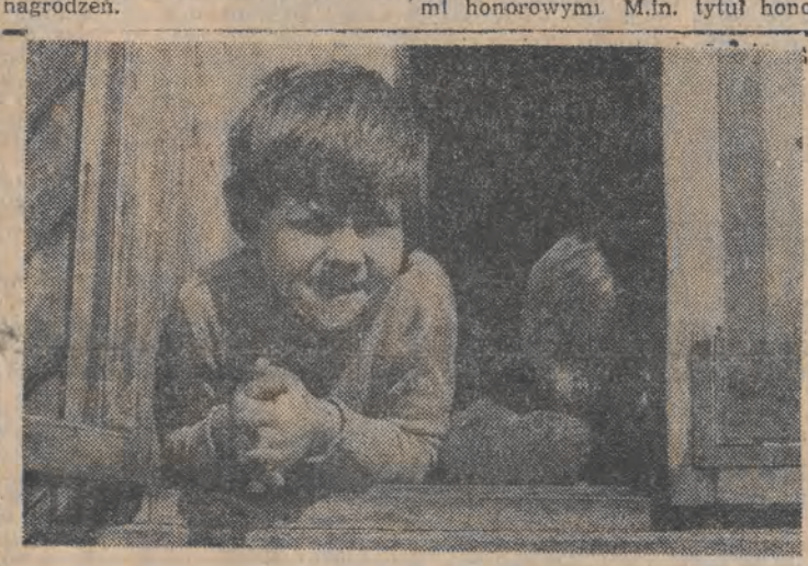
Jeszcze trochę słońca.

XIII-wieczna Biblia, która kosztowała w 1745 roku 3 funty i 6 szylingów (co wówczas stanowiło równowartość ok. 18 dolarów), kiedy to po raz pierwszy została wystawiona na licytację, w tym tygodniu została sprzedana przez dom aukcyjny „Sotheby's” za 178 tys. funtów (ponad 251 tys. dol.). Dzieło, które znalazło się na licytacji już po raz dziesiąty wystawione przez anonimowego właściciela, zostało nabyte przez londyński antykwariat „Mags”. Uzyskana cena oznacza, że na przestrzeni 241 lat wartość Biblii wzrosła 48.688 razy.