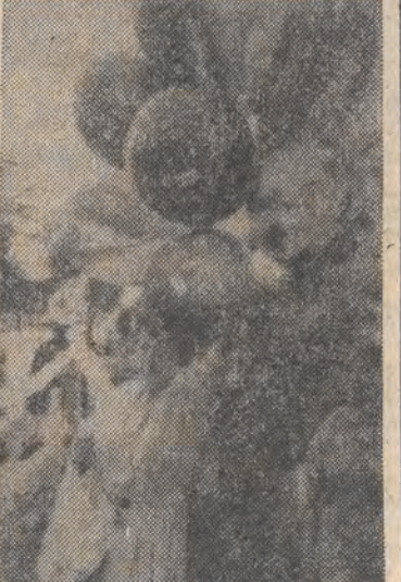
W Johannesburgu odbyła się demonstracja działaczy antyapartheidowych przeciwko przetrzymywaniu dzieci i młodzieży murzynskiej w wiezieniach. Niz: jedna z działaczek trzyma balony z nazwiskami więzionych dzieci.

Kontynuowana jest akcja oczyszczania Odry z oleju opałowego, który przedostał się do rzeki ze zbiornika kotłowni szpitala w Bohuminie. Sytuacja jest opanowana. Wyciek zablokowany został przed Raciborzem. Na 25-28 km odcinku rzeki ustawionych jest ok. 20 zapór. Ich liczba zmienia się w zależności od potrzeb i bieżącej sytuacji. Olej osiada na umieszczonych na zapórach matach słomianych, wylany jest z rzeki czepakami, a następnie palony na brzegu lub — w przypadku większych ilości — dostarczany do spalania w kotłowni przemysłowej. Do 12 bm. zebrano 30 ton, a szacuje się, że do Odry wyciekło go dwukrotnie więcej.