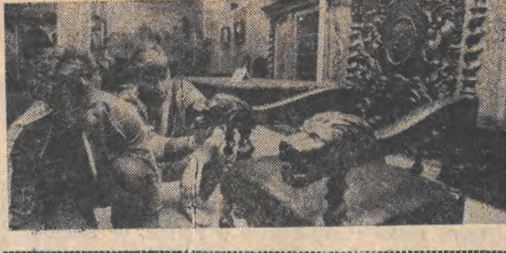
Do 2 letniego powstającego robu czynna będzie otwarta w poniedziałek w Gmachu Arsenalu w Warszawie wystawa rzeźbiarstwa artystycznego.

hlickiego, szefa jednego z departamentów resortu... W ministerstwie Inż. Okręgli jest nieuchwytny.