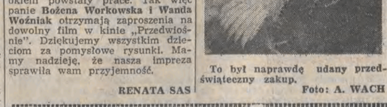
To był naprawdę udany przedświąteczny zakup.