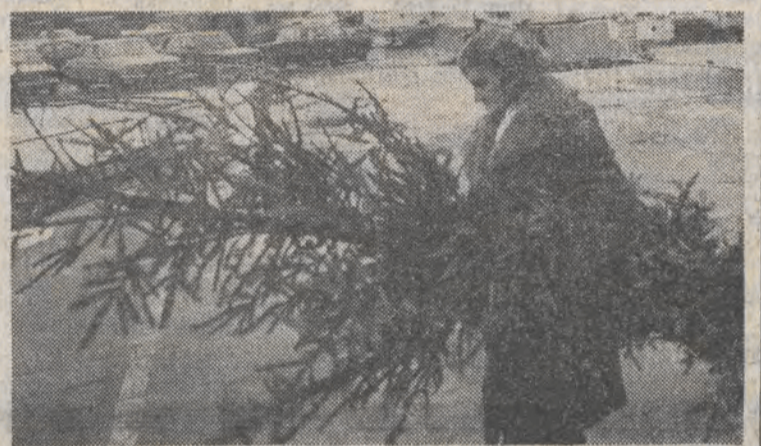
Niektórzy wołają jednak prawdziwe choinki.

Zgodnie z dobrymi obyczajami kupieckimi, wczoraj spółka „Conflexim” podejmowała swojego norweskiego agenta, dziękując mu za 40 lat owocnej współpracy. (Z. Ch.)