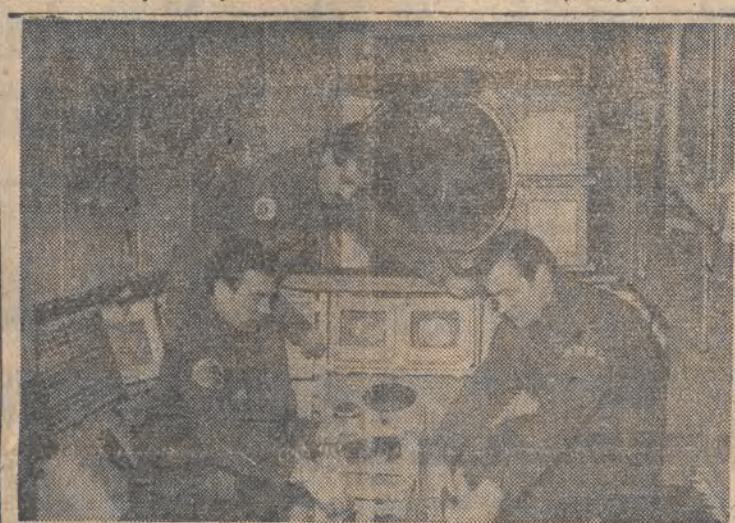
Radziecy i syryjscy kosmonauci przygotowują się do wspólnego lotu w Centrum Szkolenia Kosmonautów im. J. Gagarina. N/z.: Aleksander Wiktorenko, Muhammed Faris i Aleksander Aleksandrow.

Postanowiono zwołać kolejne posiedzenie rady 22 stycznia 1987 r.