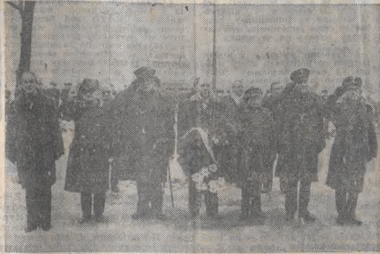
Na zdjęciu: Pod pomnikiem Powstańców Wielkopolskich wieniec składa delegacja ZBOWID z byłymi żołnierzami powstania.

27 grudnia 1918 r. wybuchło w Poznaniu powstanie wielkopolskie — pierwszy w naszych dziejach odrębny czyn powstańczy uwieczniony politycznym i militarnym sukcesem.