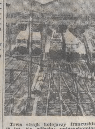
Trwa strajk kolejarzy francuskich - jeden z największych w ciągu 10 lat...