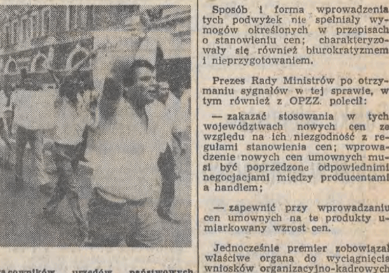
8 bm. w Peru odbył się strajk pracowników urzędów państwowych i przedsiębiorstw, którzy domagali się skrócenia godzin pracy w miesiącach letnich.

Najtrudniejsza sytuacja wytworzyła się na drogach. Rano zasy tarasowały jeden odcinek trasy o długości 0,5 km między Gdynią a Rewa, przez kilka godzin oraz kilkadziesiąt połączeń o mniejszym znaczeniu komunikacyjnym o długości przeszło 400 km. Miejscami grubość zasy sięgała metra. Najbardziej daly się one we znaki w województwach: białostockim, zamorskim, krosińskim, suwalskim, opolskim. Pozostałe arterie, według komunikatów drogowców, były co prawda przejezdne, ale prowadzenie samochodów utrudniała warstwa rozjeżdżonego, śliskiego śniegu. Łatwo też było w nim ugrzeż-