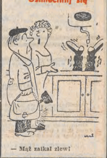
- Mąż zatkął zlew!

Taka sobie myśl Nie jest to dobrać być lepszym od najgorszego. Uśmiechnij się