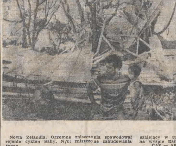
Nowa Zelandia. Ogromne zniszczenia spowodował w rejonie cyklonu Sally. N/z: zniszczone zabudowania szalejący w tym na wyspie Barocanga.

ZAGWARANTOWANE PRZEZ ZŁODZIEI Przed złodziejami brytyjskimi, którzy postanowili rozstać się ze swym „zawodem”, pojawiły się obecnie szerokie możliwości wykorzystania bogactw doświadczeń. Jedną z organizacji społecznych angażuje byłych włamywaczy do konstruowania urządzeń, które niezawodnie zabezpieczą mieszkanie przed nieproszonymi gośćmi. Ostatnio w sprzedaży znalazł się pierwszy taki zestaw: specjalna zasuwka, wizjer i urządzenie, które „nie wypuszcza” wytrzechów, używanych do otwierania tradycyjnych angielskich zamków. Efekt zdobywanego przez dziesięciolecia doświadczenia włamywaczy kosztuje nabywcę zaledwie 5 funtów szterlingów. Opr. M. C.