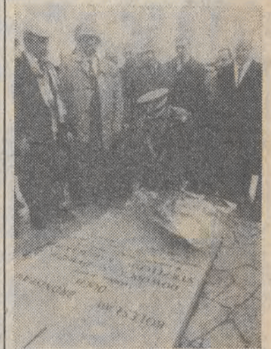
Gen. armii Wojciech Jaruzelski składa wieńce na płycie cmentarza na Monte Cassino.