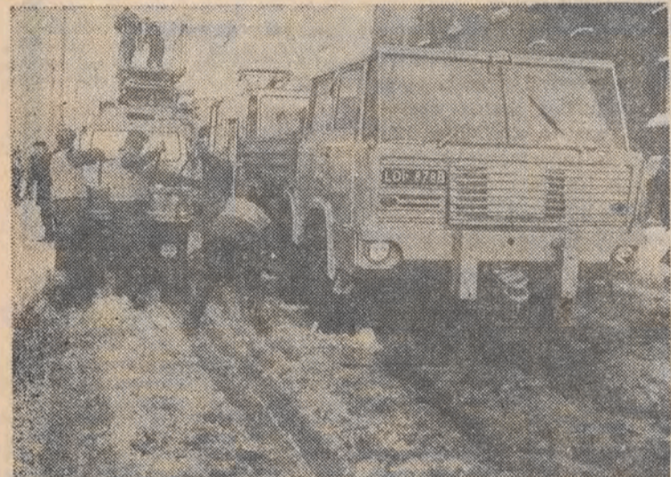
Czy słyszał kto kiedy, żeby tramwaj przemarził do szyn? Coś takiego zdarzyło się wczoraj rano na ul. Kilińskiego, pomiędzy ulicami Millionową a Strzelczyką. Kilka minut przed siódmą rano pekiła tam rzeka wodociągowa; woda zalała tory i tramwaj najwyczajniej w świecie przemarzył. A za nim stały następne... Kiedy próbowano wagon ruszyć — zerwała się siódma trakcyjna. Od 8.30 tramwaje kierowano okrężnymi trasami. Za widoczną na zdjęciu „Tatrą” stoi właśnie sznur unieruchomionych tramwajów.

Naczelnicy wszystkich dzielnic informują o licznych skargach na nie ogrzane mieszkania.