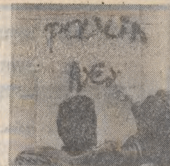
HISZPANIA. W całym kraju trwają demonstracje młodzieży szkół średnich przeciwko egzaminom wstępnym na studia. Na zdjęciu: uczniowie protestują również przeciwko brutalności policji w tłumieniu demonstracji.