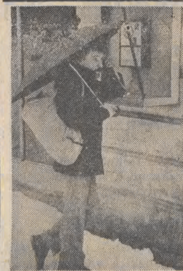
Halo, czy u was też ciepłej?