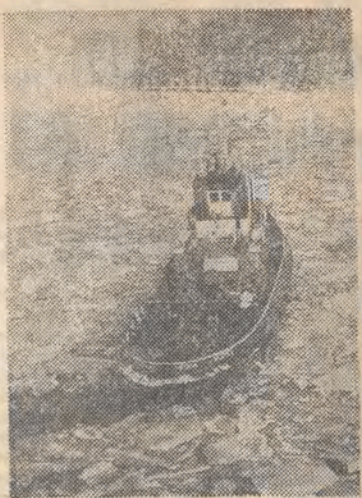
Szczecińskie holowniki, rozkruszające lód na Odrze, mają ostatnio dużo pracy.