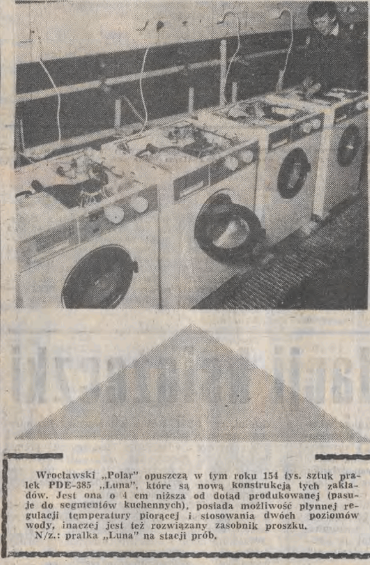
Wrocławski „Polar” opuszcza w tym roku 154 tys. sztuk praklek PDE-385 „Luna”, które są nową konstrukcją tych zakładów. Jest ona o 4 cm niższa od dotąd produkowanej (pasuje do segmentów kuchennych), posiada możliwość płynnej regulacji temperatury piorącej i stosowania dwóch poziomów wody, inaczej jest też rozwiązany zasobnik proszku. N/z.: pralka „Luna” na stacji prób.

PROGRAM II 17.30 Pół godziny dla rodziny 18.00 Wiadomości (L) 18.30 „Szamotulskie wesele” — program publ. 19.00 Przeboje „Dwójki” 19.30 Dziennik 20.00 „Polska zima” — „Spala” (L) 20.15 „Dookoła świata” — „Na Wyspach Oczwycich” 21.00 Ekran szczeroci — program publ. 21.45 Studio sport 22.45 „Ekonomia na co dzień” — „Cementowy impas” 23.15 Wieczorne wiadomości