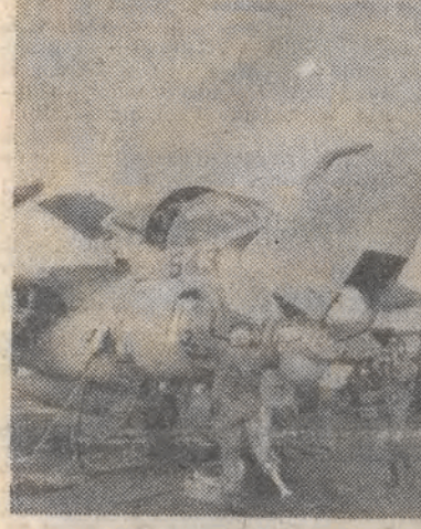
Mechanicy sprawdzają gotowość bojową samolotów na pokładzie lotniskowca amerykańskiego „John F. Kennedy” przyemuwanego u brzozy Hajfy (Izrael).

Niedoszły samobójca, który tego samego dnia miał składać zeznania przed prezydencką komisją w sprawie afery irańskiej, został w porę odwieziony do szpitala i jego życiu nie zagraża niebezpieczeństwo.