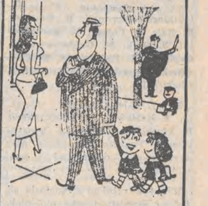
— Powiemy mu, że to nasza nauczycielka?

W okolicach Wrocławia największe szkody wyrządziła rzeka Olawa — dopływ Odry. Zalala wiele pól i zagrożła gospodarstwom we wsi Groble. N.z.: zalane przez Olawę gospodarstwo w Groble.