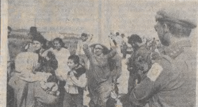
Fiński żołnierz z sił pokojowych ONZ obserwuje uchodźców palestyńskich niosących zapasy żywności do obozu w Bejrucie.

stuje przerwę w oblężeniu jedynie dla zdobycia żywności i powraca do dotychczasowych siedzib, nie mając innych możliwości. Donie-