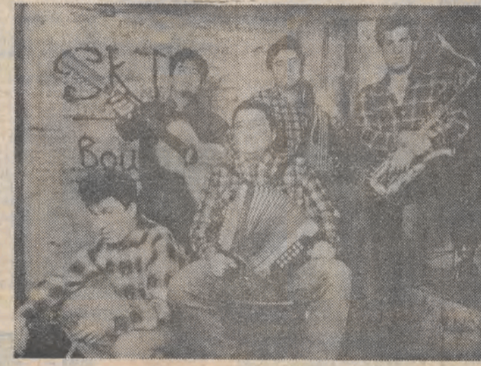
Zespół Los Lobos

POZIOMO: 1. Przesady 8. Aura 9. Zgryzota 10. Opera Belliniego 11. Odwiedziny 12. Król Polski od 1576 roku 13. Opłata urzędowa pobierana za pewne usługi 14. Czarownik u Eskimosów 15. Do założenia 20. Ptak z rzędu papug 21. Bogini rzek i jezior w wierzeniach pogańskich Litwinów 22. Stolica Turcji 23. Działo o płaskim torze pociągu 24. Spada z drzewa kokosowego 25. Powleczenie 26. W mitologii greckiej władca Sybilosu w Lidii (także pierwiastek chemiczny) 27. Ryba z karpioiwatych 28. Lech Piasecki lub Stanisław Szozda 29. Może być sprawiedliwości 30. Ryba z rodziny śledziowatych.