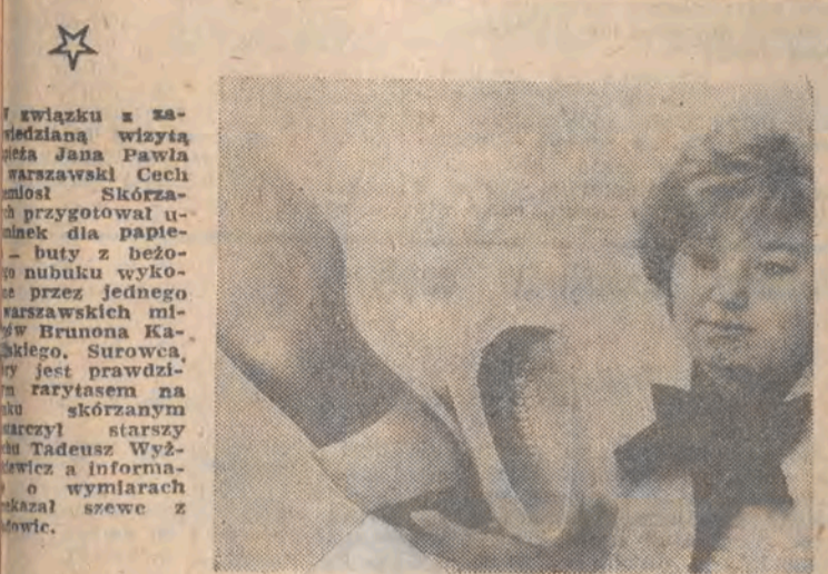
W związku z nadchodzącą wizytą w Łodzi pani Jana Pawła...