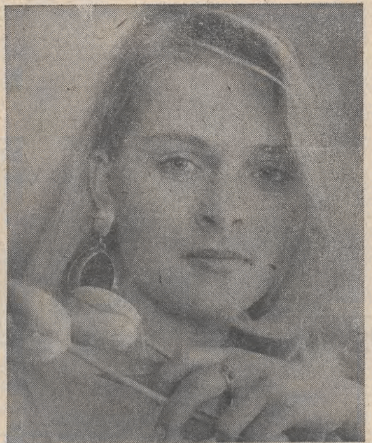
Naszym dziewczętom, panienkom, paniom, życzymy samych tylko słonecznych dni.

B iuuro Prasowe Rządu informuje: 6 bm. Rada Ministrów oceniła wstępnie wyniki gospodarcze i realizację Centralnego Planu Rocznego w 1986 roku. Stwierdzono, że w gospodarce dominowały tendencje pozytywne — czego wyrazem był wzrost w większości sfer produkcji i usług. Dochód narodowy wytworzony wzrósł o ok. 5 proc., wobec zakładanego w CPR o 3,1—3,4 proc. W przeliczeniu na jednego mieszkańca tempo wzrostu dochodu narodowego wytworzonego wyniosło ponad 4 proc. Zanośwano stosunkowo szybki wzrost spożycia i poprawę warunków życia społeczeństwa, zwłaszcza w zakresie wyżywienia. Wzrost produkcji w przemyśle osiągnięto przy wzroście wydajności pracy, obniżeniu energochłonności i lepszym wykorzystaniu majątku trwałego i czasu pracy. Jednocześnie jednak nie osiągnięto zamierzonej poprawy równowagi ekonomicznej. Nie uzyskano zakładanego dodatniego salda obrotów z krajami II obszaru płatniczego, co w połączeniu ze spadkiem kursu dolara do innych walut spowodowało poważny wzrost spłaty i poprawę warunków życia społeczeństwa, zwłaszcza w zakresie wyżywienia.