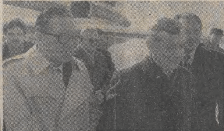
Na zdjęciu: podczas powitania na lotnisku minister Wu Xueqian i minister spraw zagranicznych PRL Marian Orzechowski.

Na zaproszenie członka Biura Politycznego KC PZPR, ministra spraw zagranicznych MARIANA ORZECHOWSKIEGO, 10 bm. przybył z oficjalną wizytą do Polski członek Biura Politycznego KC KPCh członek Rady Państwowej, minister spraw zagranicznych ChRL WU XUEQIAN. Oczekuje się, że podczas tej pierwszej w dziejach kontaktów dwustronnych wizyty oficjalnej szefa dyplomacji chińskiej w Polsce omówiony zostanie całokształt wzajemnych stosunków, zwłaszcza politycznych, kulturalnych i gospodarczych.