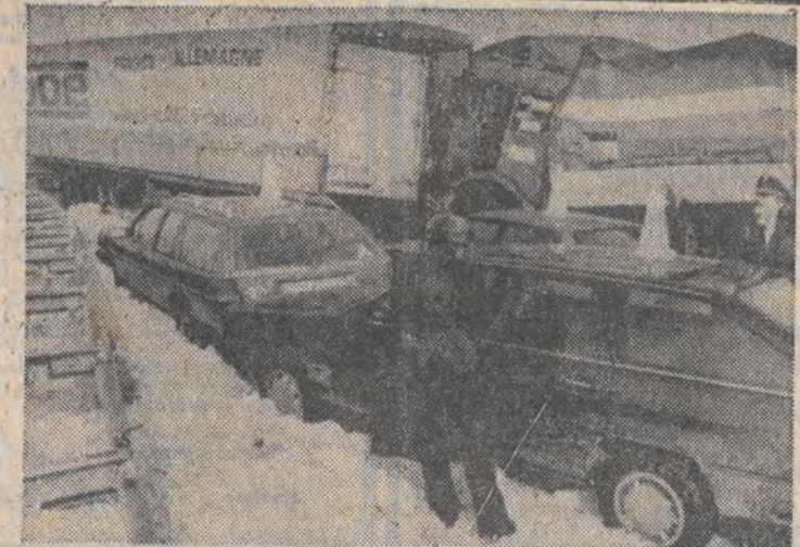
10 ciężarówek i 30 samochodów zderzyło się na szosie w pobliżu Getyni (RFN) na skutek oblodzenia i śnieżyicy. 6 osób odniosło poważne obrażenia.