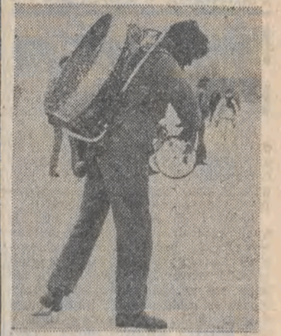
Ze śmigielkiem na plecach latwiej...

Stosunki polsko-amerykańskie • Kłopoty polskich turystów w Szwecji • Sprawa Z. Najdera.