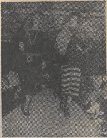
NRD. W Polskim Ośrodku Kultury i Informacji odbył się pokaz mody warszawskiej spółdzielni „Poziom”.

Wydanie I ŁÓDŹ, środa, 11 marca 1987 roku CENA 10 ZŁ Rok XLIII 59 (12269) PL ISSN 0208-7707 Nr indeksu 36004