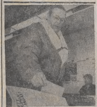
15 bm. w Finlandii rozpoczęły się dwudniowe wybory do parlamentu tego kraju.

rażają zainteresowanie podjęciem wielu przedsięwzięć inwestycyjnych w Polsce; nie wykluczając też możliwości przystąpienia do Joint Ventures. Strona polska podkreśla konieczność przywrócenia normalnych stosunków finansowo-kredytowych między naszymi krajami, jako niezbędnego warunku ożywienia współpracy.