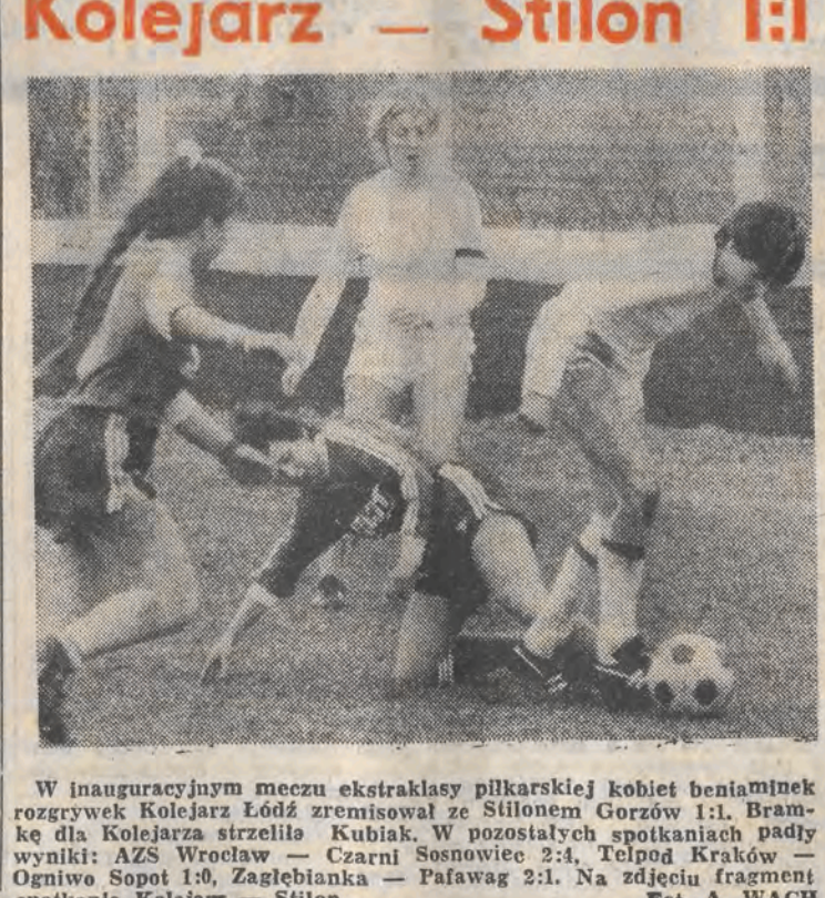
W inauguracyjnym meczu ekstraklasy piłkarskiej kobiet beniaminek rozgrywek Kolejarz Łódź zremisował z Stilonem Gorzów 1:1.