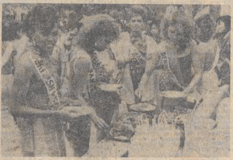
Kandydatki na Miss Universum przebywają w Singapurze, próbując m. in. przysmaków miejscowej kuchni.

Jak podała w piątek Światowa Organizacja Zdrowia, liczba chorych na AIDS rosła w sposób zastraszający. W ciągu 48 godzin (od 4 do 8 maja br.) zarejestrowano na świecie 600 nowych przypadków zachorowań. Obecnie oficjalnie dane mówią o 48 527 chorych. Na pierwszym miejscu tej tragicznej statystyki plasują się nadal Stany Zjednoczone (35 068 przypadków), na drugim Francja (1 221), a następnie Uganda, Tanzania, RFN, Brazylia i Kanada, które zarejestrowały nieco powyżej 1000 przypadków.