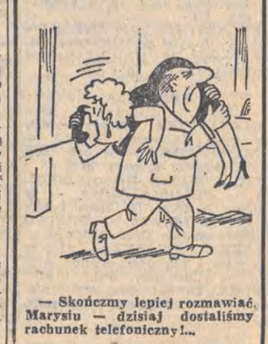
— Skończmy lepiej rozmawiać. Marysiu — dzisiaj dostaliśmy rachunek telefoniczny!..