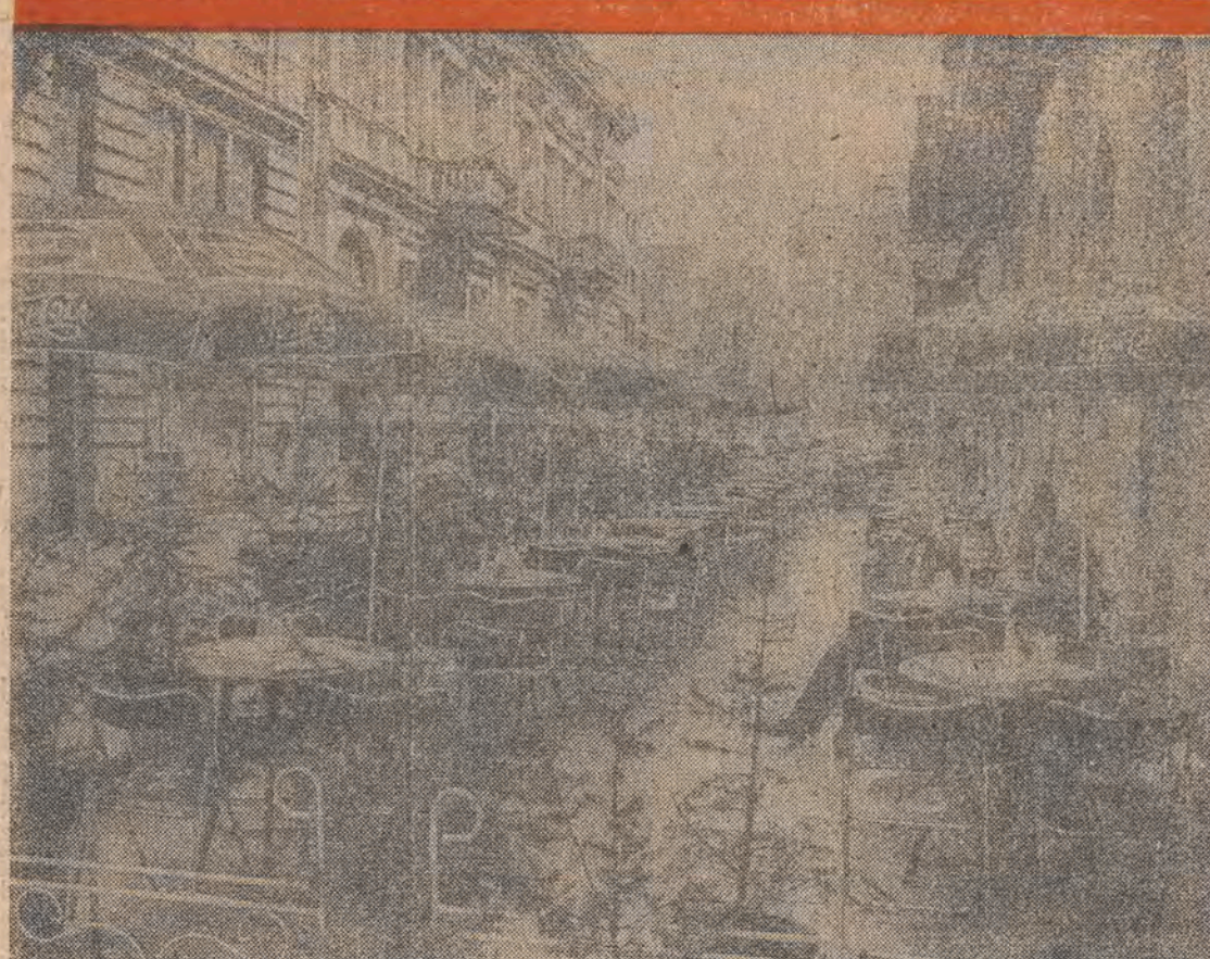
Klientem przyjemnie, personelowi wygodnie, bo nie duszno, a przechodzącym obok też się podoba — słowem ogródek przed łódzką „Halką” ma same plusy.