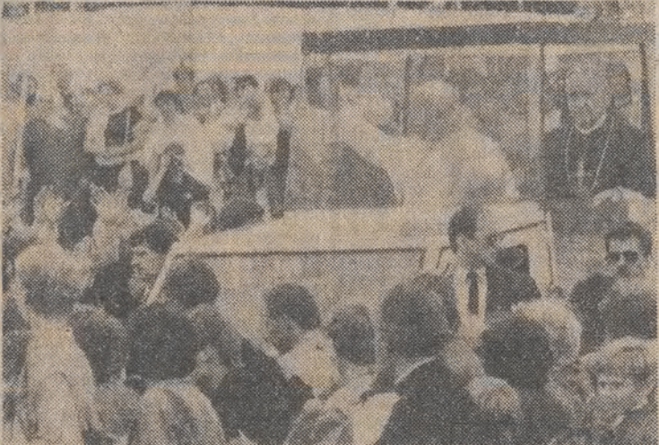
Papież Jan Paweł II podczas przejazdu ulicami Tarnowa w drodze na mszę beatyfikacyjną.

W TARNOWIE, NAJWAŻNIEJSZYM AKCENTEM UROCZYSTOŚCI Z UDZIAŁEM PAPIEŻA BYŁA BEATYFIKACJA KAROLINY KÓZKÓWNY. POZYWNY POPOŁUDNIEM JAN PAWEŁ II ZOSTAŁ POWITANY NA KRAKOWSKICH BŁONIACH, GDZIE WYGŁOSIŁ DO ZGROMADZONYCH PRZEMÓWIENIE. A NASTĘPNIE KONCELEBROWAŁ MSZĘ W KATEDRZE NA WAWELU.