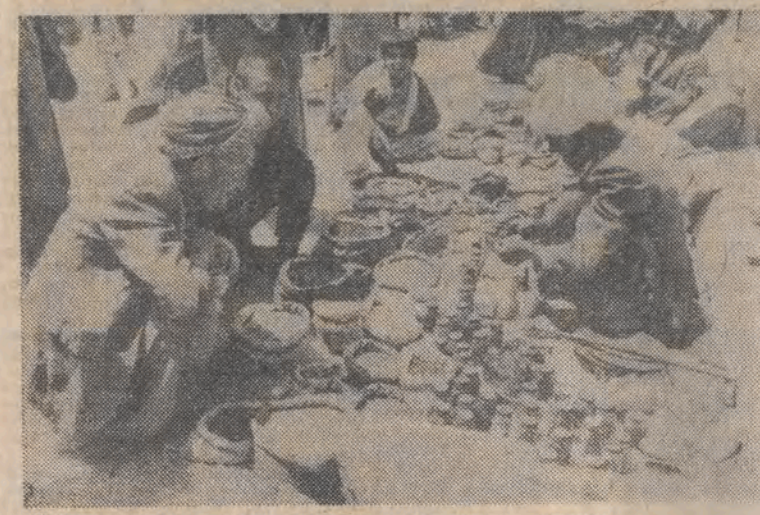
Typowa scenka z targu w stolicy Afganistanu Kabulu.