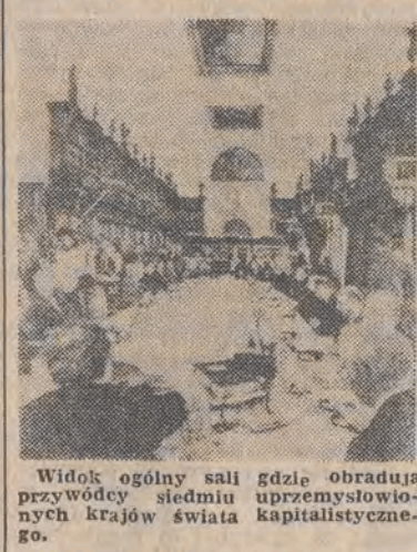
Widok ogólny sali gdzie obradują przywódcy siedmiu uprzemysłowionych krajów świata kapitalistycznego.

Kluczową — jak píše Agencja Reutera — częścią zestawu posunięć jest zapowiedź koordynacji celów polityki gospodarczej i kontroli wcielania jej w życie, za pomocą serii wskaźników, takich jak kursy walutowe, stopa inflacji, stopa wzrostu gospodarczego i dwustronne bilanse handlowe. Deklaracja nie będzie jednak zobowiązywać poszczególnych państw do modyfikacji ich polityki gospodarczej w wypadku rozbieżności.