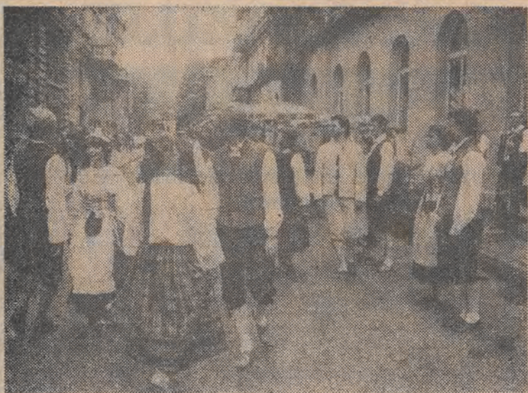
JAK W FINLANDII. Muzyka i piosenki dobiegające z ogródka restauracji „Halka” ścigały wieczorem wielu łodzian z ul. Piotrkowskiej na ul. Moniuszki. A tam w efektywnym programie prezentowały się grupy folklorystyczne „Pispalana Pelimanni” i „Pispaset”, zbierające zasłużone brawa. Tak oto kolejny akcent trwających w Łodzi Dni Tampere przypadł do gustu mieszkańcom miasta, a folklor Finlandii wyraźnie zyskał akceptację.