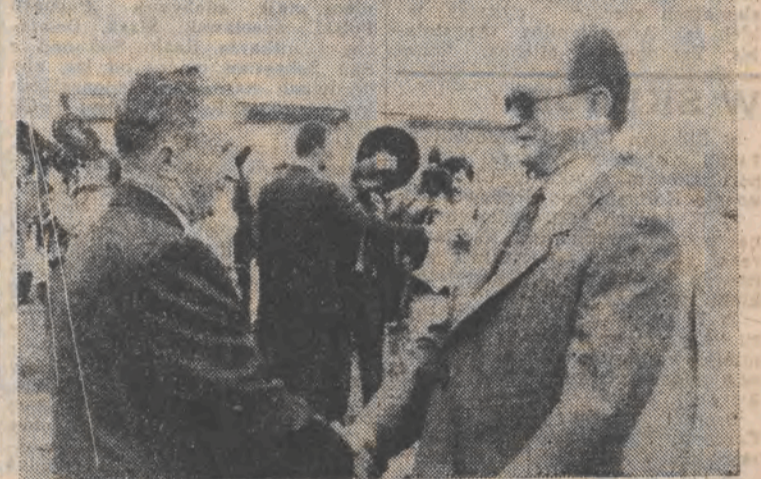
N/z: powitanie na warszawskim lotnisku Okęca.

W godzinach wieczornych Nicolae Ceausescu, żegnany przez Wojciecha Jaruzelskiego i członków