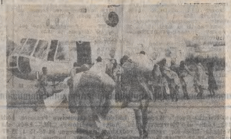
Polskie śmigłowce, zwane przez Etiopczyków „Białymi orłami”, do- starczają zboże głodującej ludności.

Piloci pierwszej i drugiej zmia- ny wspólnie z pilotami innych