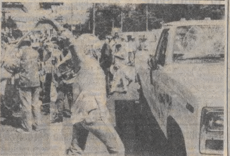
SALWADOR, 3 osoby zostały ranne, kiedy policja otworzyła ogień do demonstrujących robotników. Na zdjęciu: demonstrant rozbija szybę rządowego samochodu.

Obrazy trafiły w ręce policji w Stuttgarcie (RFN) w ciągu ostatnich 9 miesięcy. Zatrzymano 57-letniego mężczyznę. Śledztwo trwa.