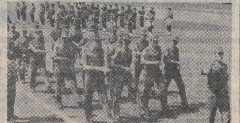
Nasi piloci po wykonaniu zadania w Etiopii, na uroczystej zbiórce na jednym z lotnisk śmigłowców transportowych.