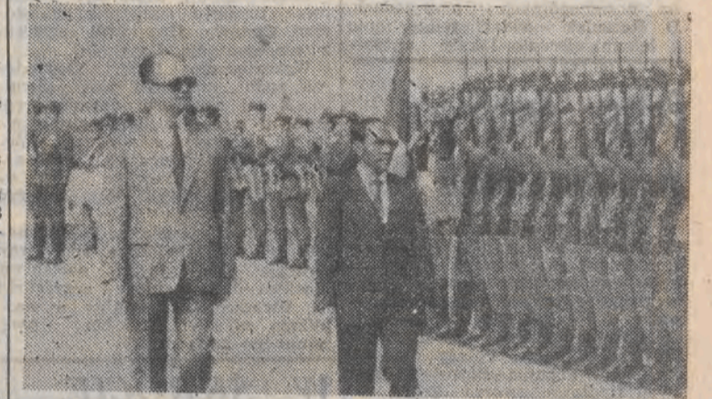
N/z: podczas powitania na lotnisku Okęcie Wojciech Jaruzelski i Heng Samrin przed frontem kompanii honorowej.

Na warszawskim lotnisku Okęcie gości powitał przedstawiciel władz partyjno-państwowych z Wojciechem Jaruzelskim. Tego dnia i sekretarz KC PZPR, przewodniczący Rady Państwa