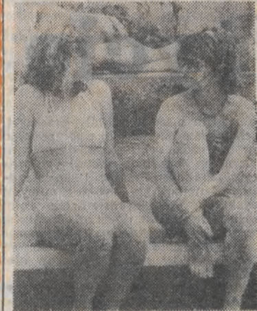
Jak się znużdzi opalanie, można sobie trochę popłokować...