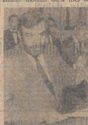
Premier Włoch Giovanni Goria udziela wywiadu dziennikarzom na temat składu nowego rządu.

Od wtorku wieczorem Włochy mają nowy rząd. Desygnowany premier Giovanni Goria (DC) na