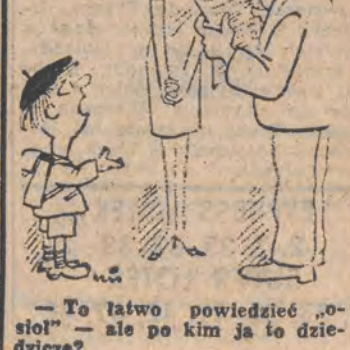
— To łatwo powiedzieć „o-sioł” — ale po kim ja to dziecię?