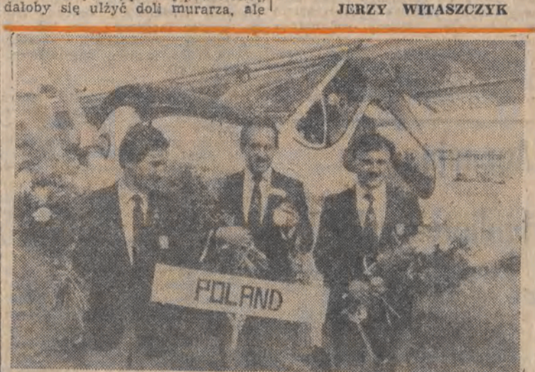
17 bm. na warszawskim lotnisku Bemowo powitano ekipę naszych biotów, która podczas MS w lataniu precyzyjnym zdobyła wszystkie medale w klasyfikacji indywidualnej i złoto drużynowo...