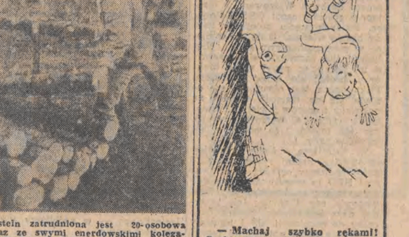
NRD. W lasach koło Bad Lieben stein zatrudniona jest 20-osobowa grupa młodzieży z Polski, która wraz ze swymi niemieckimi kolegami pracuje przy usuwaniu wiatrolomów i sadzeniu drzew.