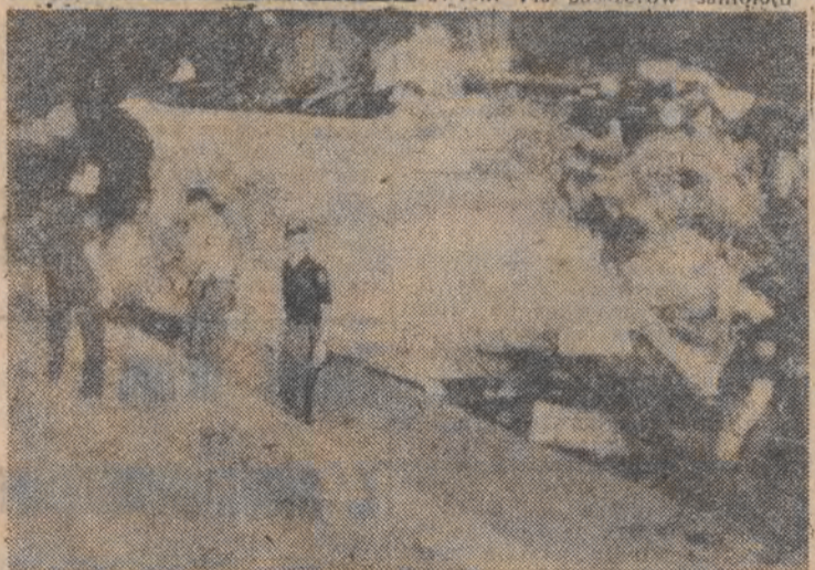
Trwa akcja ratunkowa na miejscu katastrofy.

W poniedziałek zmarł w brytyjskim szpitalu wojskowym w Berlinie Zachodnim w wieku 93 lat jeden z głównych przestępców hitlerowskich Rudolf Hess. Skazany na dożywotnie więzienie w norymberskim procesie hitlerowskich zbrodniarzy wojennych, przebywał od 1947 r. w zachodniobermberskim więzieniu Spandau.