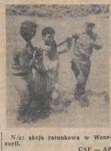
N/z: akcja ratunkowa w Wenezueli.