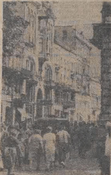
Na ulicy Piotrkowskiej w południe. Fot.: A. WACH

Na 4-krotne dożywcie więzienie został skazany sanitariusz ze szpitala w Cincinnati 35-letni Donald Harvey za spowodowanie śmierci ponad 50 pacjentów. Harvey, nazwany przez prasę „aniołem śmierci” od roku 1970 systematycznie pozbawiał życia niektórych chorych aplikując im cyjanek, arsenik, trujące na szczyry lub wstrzykując dożylnie narkotyki. Wyrok zawiera klauzulę, że skazany będzie mógł ubiegać się o darowanie kary, gdy osiągnie wiek 95 lat.