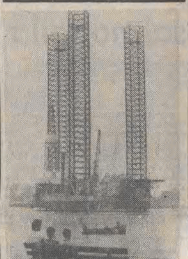
Holandia. W porcie Rotterdamu zamocowano platformę do poszukiwania ropy pod dnem morza. Na okres trzech miesięcy adostepniono ją zwiedzającym, ale jeśli okaże się prawdziwą atrakcją turystyczną, zostanie na stałe.