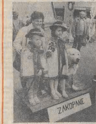
Pamiętka z Zakopanego.