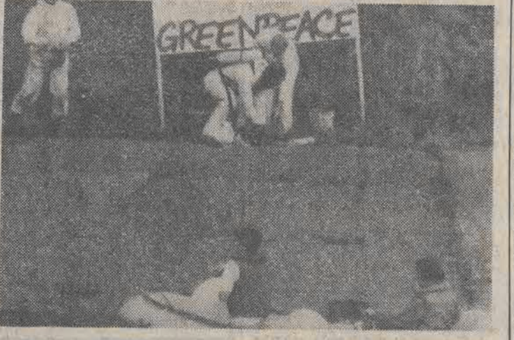
BELGIA. Aktywiści GREENPEACE protestowali w Jemeppe przeciwko spuszczeniu do lokalnej rzeki ścieków z fabryki chemicznej Solvay.