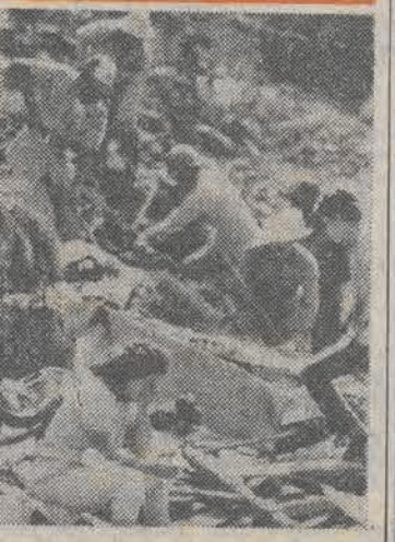
N/z: akcja ratunkowa na terenie katastrofy.